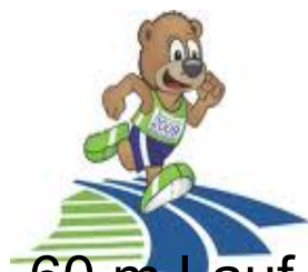
60 m Lauf